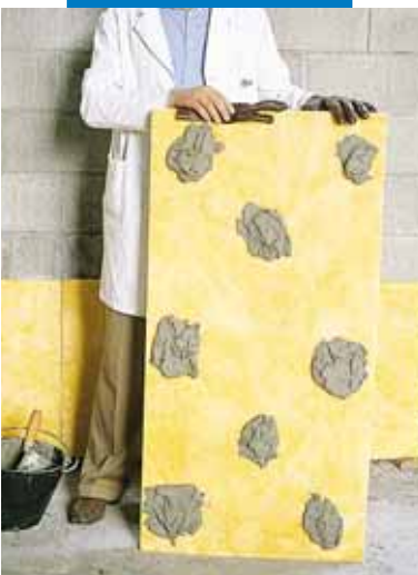
Клеевое крепление изоляционных панелей на неотделанную стену

Список значимых объектов использования данного материала доступен по требованию